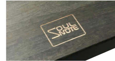
前面中央部にロゴを刻印