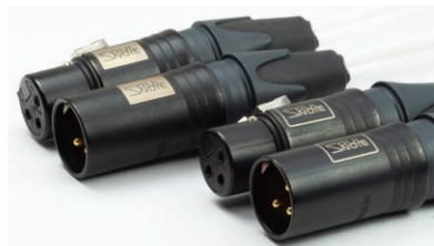
ペアが判別しやすい2種類のロゴを刻印

RBC-1 ¥129,800 (税込) JAN 4580197835181 RBC-3 ¥165,000 (税込) JAN 4580197835839 RBC-5 ¥198,000 (税込) JAN 4580197836386 RBC-7 ¥231,000 (税込) JAN 4580197835846