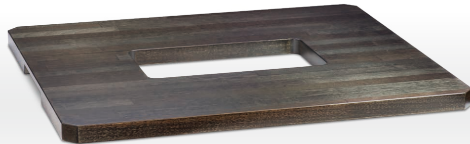
RSB-1 (ブラック) ¥30,800 (税込) JAN 4580197837321

3 シリーズに添付している標準ボード。 RSS-1 との組み合わせで仮想 RAR となります。