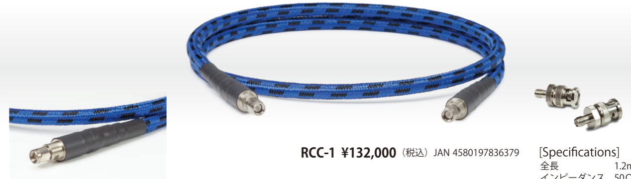
高周波特性に優れた SMA コネクタを使用

人工衛星グレードの線材から生まれたリファレンスクロックケーブル。 X-3 を最大限に活かし、音楽から魂のオーラを解き放ちます。