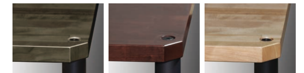
ブラック ブラウン ナチュラル