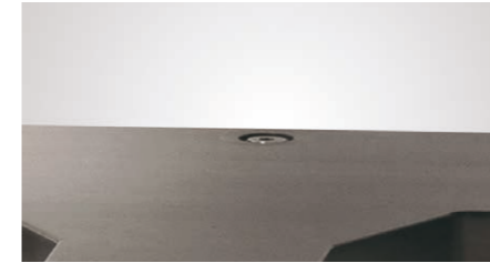
3 本接地の場合の中央ポール取付け穴。 隣の 2ヶ所はポールにスパイクの代わりに 転倒防止サポートを取り付けます。